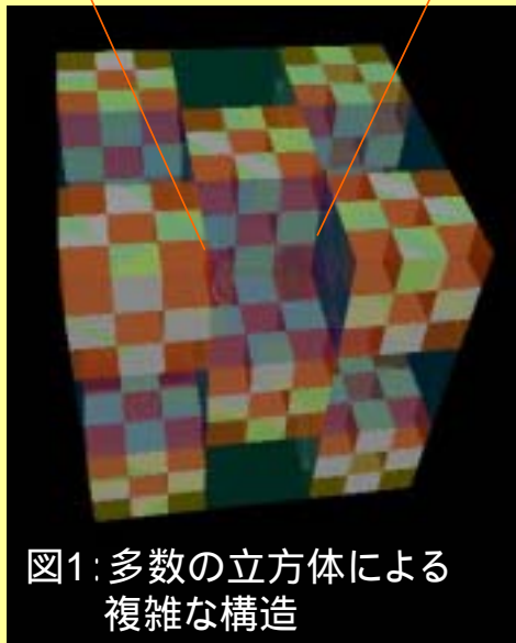
図1: 多数の立方体による複雑な構造