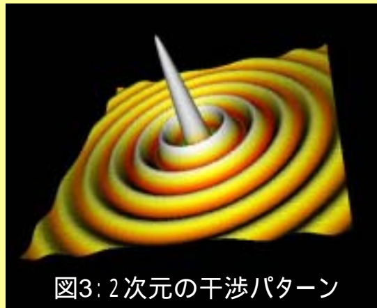
図3: 2次元の干渉パターン